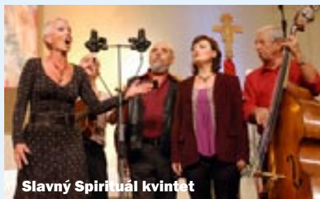
Slavný Spirituál kvintet

KONCEM ZÁŘÍ SE V MORAVSKOSLEZSKÉ METROPOLI USKUTEČNIL BENEFIČNÍ KONCERT SEŠLI SE, ABY POMOHLI UPOŘÁDANÝ CHARITOU OSTRAVA NA PODPORU HOSPICE SV. LUKÁŠE. PODAŘILO SE VYBRAT CELKEM 137 349 KČ, KTERÉ PŮJDOU NA JEHO ROZŠÍŘENÍ!